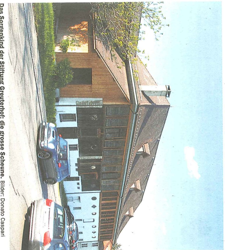
Das Sorgenkind der Stiftung Greuterhof: die grosse Scheune.

Greuterhof-Fest Samstag, 1. Mai, von 10 bis 16 Uhr, Hauptstrasse 15, Islikon