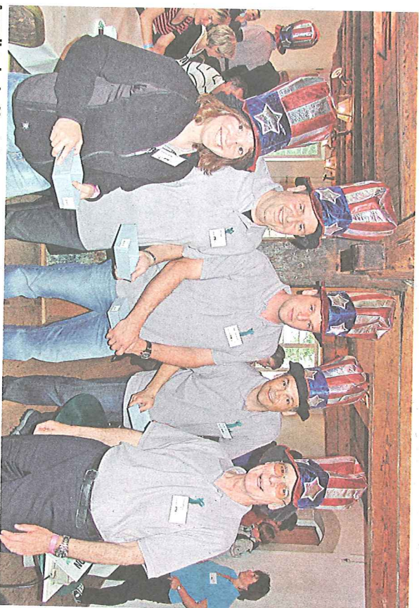
Amerikanische Versteigerung – ein Spass für sich!

lern, die Versteigerungen und die leiblichen Genüsse. Aber auch der Rundgang durch die Räumlichkeiten in den historischen Gemäuern war eins der Highlights. Unsere Bilder sprechen Klartext: