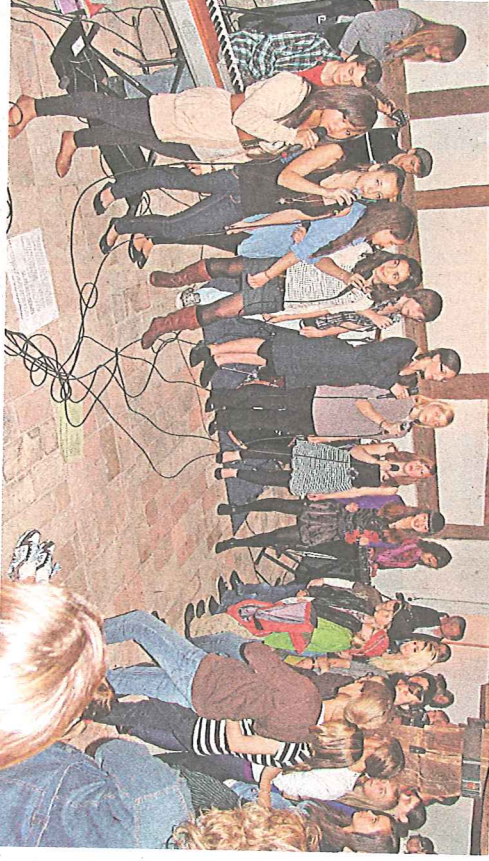
Ein Fest, das nicht zu verpassen war: Das Greuterhoffest am Samstag!