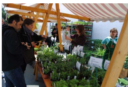
Der Setzlingsmarkt setzte einen grünen Akzent