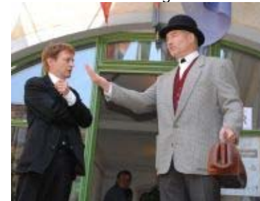
Auch Sherlock Holmes und Dr. Watson beehrten den Greuterhof.

Das OK Greuterhoffest dankt allen Helfern, Teilnehmern und den Besuchern für einen wunderschönen, sonnigen Sonntag im Greuterhof.