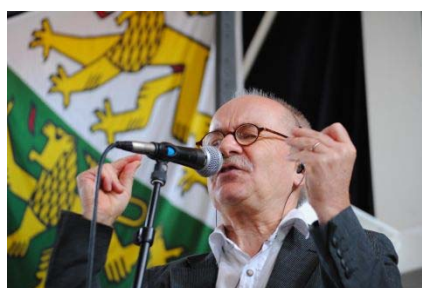
Die Galgevögel füllten die Greuterscheune an beiden Konzerten und begeisterten Hunderte.