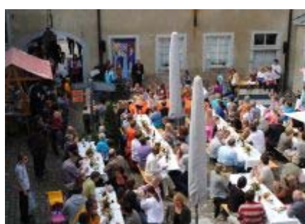
Der Innenhof wird zum Festplatz