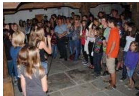
Im Tavernenkeller heizen die Jugendbands der SEK Reutenen so richtig ein zur Kühlung werden alkoholfreie Cocktails angeboten