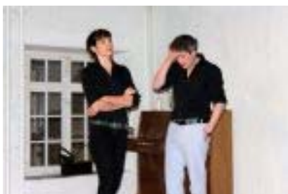
Die Improvisationskünstler des Eidgenössischen Improvisationstheater Zürich