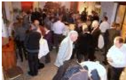
Die Gäste geniessen den Stehapéro